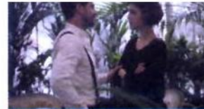
22.00 LA SEÑORA. Serie. Ángel pide ayuda a Victoria.

06.00 Noticias 24 horas 07.00 Telediario matinal 09.00 Los desayunos de TVE 10.15 Saber vivir. Divulgativo. 11.30 Esta mañana. Magazine. 13.00 La lista. Concurso. 14.00 Informativo territorial 14.30 Corazón de invierno 15.00 Telediario 1. Informativo. 15.55 El tiempo. Informativo. 16.00 Amar en tiempos revueltos NOVELA Camilo pide disculpas a Sole por haber adaptado para la radio la historia del asesino de mujeres. La fotógrafa se asusta al quedarse sola por la noche, pensando que anda suelto un criminal.