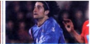
20.30 BAYERN DE MÚNICH-GETAFE C.F. Copa de la UEFA.

20.35 Smallville SERIE Intérprete: Tom Welling. 21.30 Sorteo Lotería Primitiva v Lotería Nacional